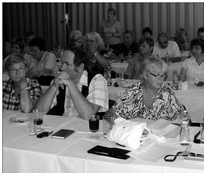
Záběr na členy 6. pléna OS TOK