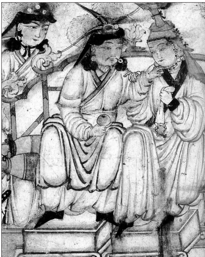
Účastníci hostiny ve vznešeném mongolském šatu (miniatura z poloviny 14. století)

Mgr. Jan Harvilko, UPM – Muzeum textilu Česká Skalice Repro: autor