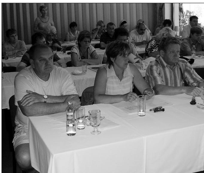
Členové pléna při jednání