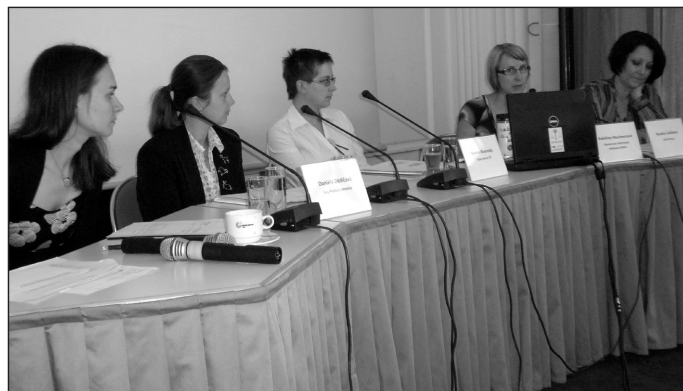
Účastnice panelové diskuze

OS TOK se spolu s ATOK zapojil do projektu Bipartitní dialog (BiDi) a je tak jednou z celkem 11 platforem projektu pod názvem TOP (Textilní a oděvní průmysl). V projektu se chceme věnovat celkem pěti různým tématům: v současné době jsou zpracovány studie ke dvěma z nich, a to pod názvy „ Dopady uplatňování minimální mzdy na odvětví textilního a oděvního průmyslu “ a „ Dopady (ekonomické ztráty/možné efekty) vlivem předčasného odchodu z pracovního procesu věkové skupiny nad 55 let v odvětví textilního a oděvního průmyslu “. Ke každé studii je zorganizováno celkem pět workshopů a závěrečná konference, jichž se pravidelně účastní interní i externí experti a realizační tým OS TOK, případně přizvaní hosté. (palmir)