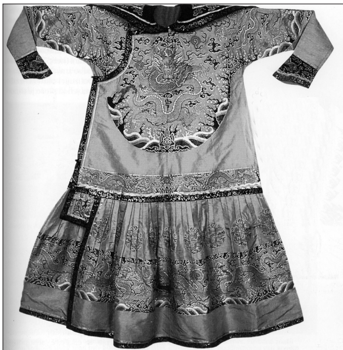
Císařské čhao-fu. Tento oděv pochází z poloviny 18. století. Na žlutém podkladu je dekor draků, později se na sukni objevuje dekor císařských symbolů.

Následuje kapitola Z hlubin dávnověku , která sleduje archeologické nálezy a písemné prameny přibližně po dobu dvou tisíciletí do změny letopočtu. Z hrobů vládnoucí vrstvy pocházejí cenné informace o oděvech a jejich zdobení, psané doklady osvětlují jejich společenskou a rituální funkci. Zařazena je zde též problematika tkalcovských technik a způsobů vzorování textilií. Kniha pokračuje kapitolou Po hedvábné cestě , nastiňující výklad o soustavě těchto cest vedoucích z Číny až do Evropy včetně námořní trasy táhnoucí se kolem jihovýchodní Asie, Indickým oceánem k Arabskému poloostrovu. Po těchto cestách putovaly nejen hedvábné tkaniny, ale i další ozdobné zboží včetně vzácných kovů a drahých kamenů. Komunikace po